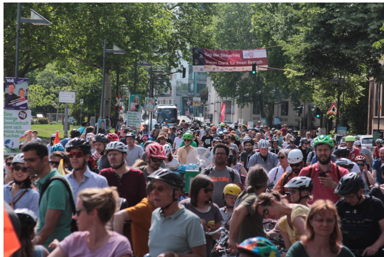
Zwischenstopp am Eisernen Steg

Kontakt: mail@kidicalmass-ffm.de ; anja.littig@web.de