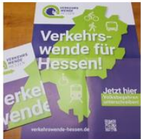
Plakat A2 (gefaltet)